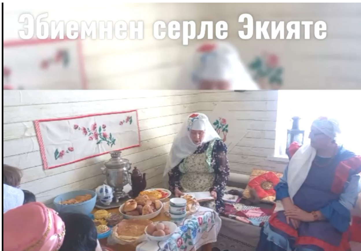
Фото 2: Элемент фотографии обряда «Эбиемнен серле Экияте» в селе Новогафарово Саракташского района Оренбургской области.

Обряд начинается с того, что женщины и дети, в пятничный день, с угощениями идут в гости к Ак абыстай (так называют самого уважаемого старожилы села), которая учит любить Родину, чтить традиции и обычаи, помогает женщинам советами, призывает не забывать старинные песни и свой родной язык.