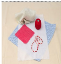
1. материалы для изготовления оберега