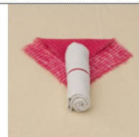
3. находим центр и обозначаем пуп с помощью нити