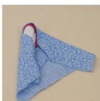
5. Запеленать тело куклы подобно ребенку