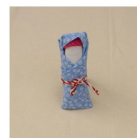
6. Последним шагом повязать пояс узелком вперед.

Для этого понадобится ткань для основы любого цвета ;светлый лоскут для тела; яркий материал для косынки; ткань для пеленки; красная шерстяная нить; лента.