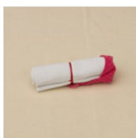
4. повязываем косынку, концы спрятать сзади.