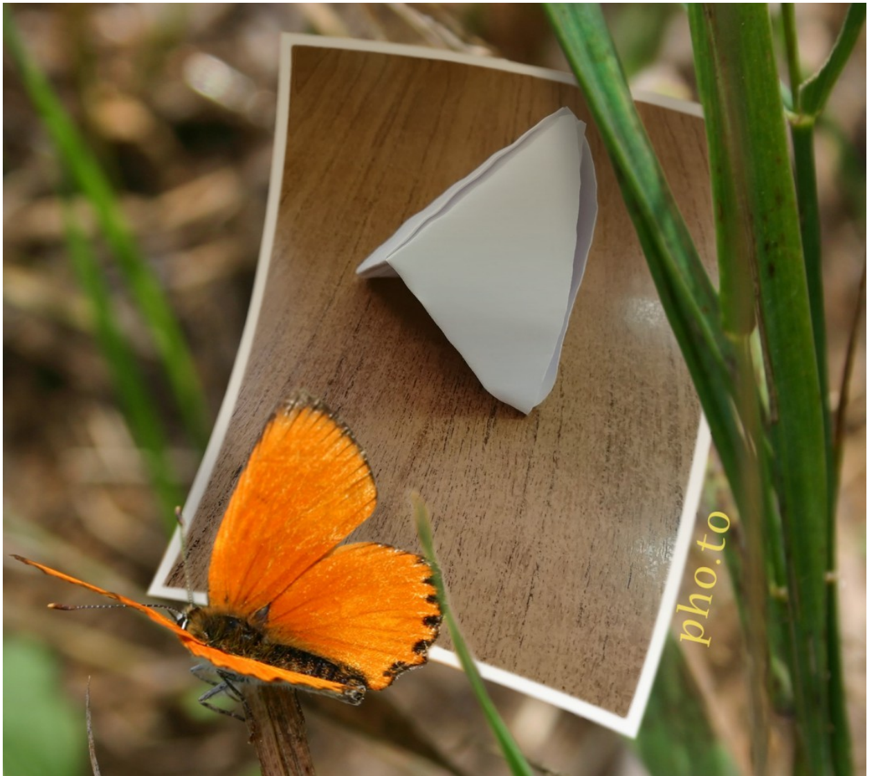
Получалась оригами в виде лодочки.