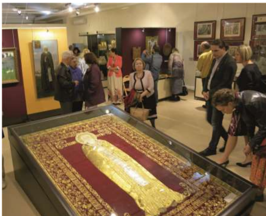
На выставке «И свеча не угасла...» СПМЗ. 2014 г.

Выставка состояла из нескольких тематических комплексов, посвященных конкретным областным музеям, в которые входили фотографии и предметы, размещенные на подиумах и манекенах. Постеры, развешенные по мобильным стенам, являлись своеобразным фоном-задником, визуализирующим информацию о месте нахождения и облике зданий-памятников, а также внутреннем убранстве интерьеров музеев, где расположены уникальные предметы. Музейные экспонаты (до 10 единиц) размещались рядом, формируя у зрителя ощущение подлинности и аутентичности видимого пространства. Предметы сопровождала фотография его состояния до реставрации. В число музей-