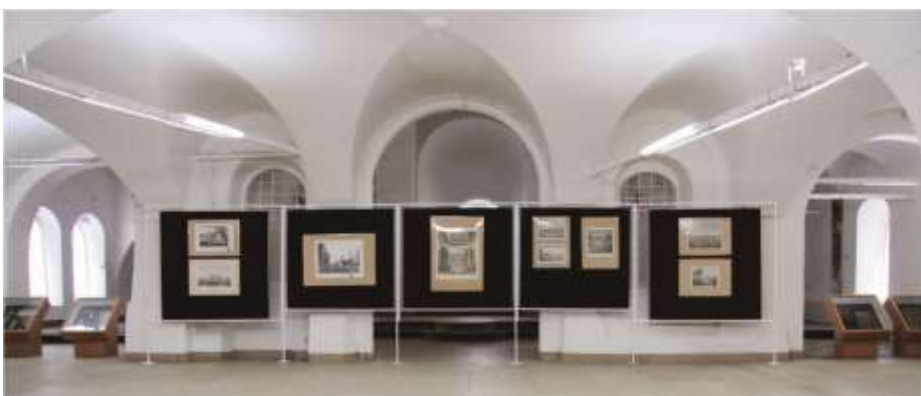
Выставка «За веру христианскую». Восточная сторона, общий вид