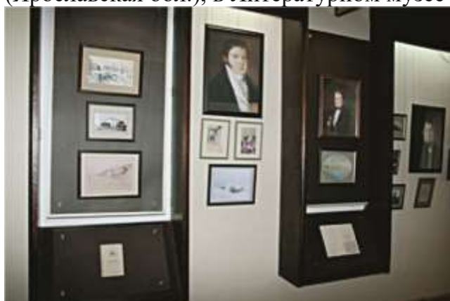
Демонстрация выставки в музее-усадьбе Н.Г. Чернышевского (г. Саратов)

Выставка «И.А. Гончаров и Симбирск» была создана в год 200-летия со дня рождения И.А. Гончарова – в 2012 году. За это время в рамках межвыставочного обмена экспонировалась в Музее-усадьбе Н.Г. Чернышевского (Саратов), в Государственном литературно-мемориальном музее-заповеднике Н.А. Некрасова «Карабиха» (Ярославская обл.), в Литературном музее г. Пенза.