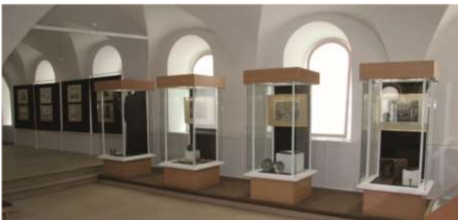
Выставка «За веру христианскую». Южная сторона, общий вид