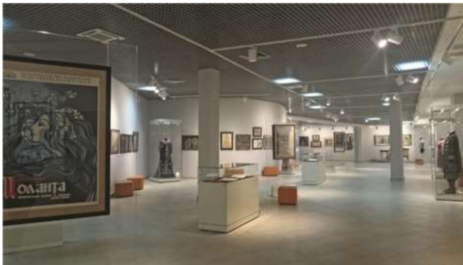
Выставочный проект «Театр Чайковского» в МВК «Новый Иерусалим»

Особое место в нестационарной деятельности музеев занимают обменные выставки из музейных собраний, которые, как правило, строятся на взаимном профессиональном интересе в сфере научно-исследовательской деятельности, общности профиля собрания и предмета комплектования, междисциплинарном, комплексном подходе. Такие выставки являются результатом высокой степени изученности коллекций, хорошей сохранно-