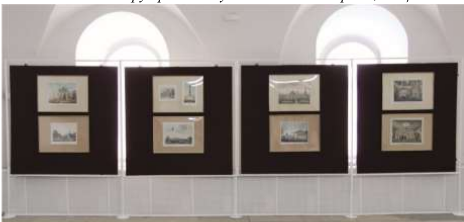
Щиты на стойках. Общий вид

нарных выставок, предназначенных для демонстрации как на территории субъекта, так и в регионах Российской Федерации.